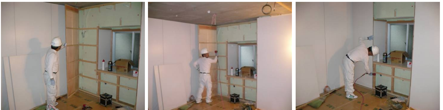
「あいち認証材」スギ芯材パネルの施工状況