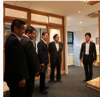
ショールームを視察される真砂市長 (左から3人目)