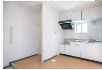
間仕切りパネルとキッチンユニット