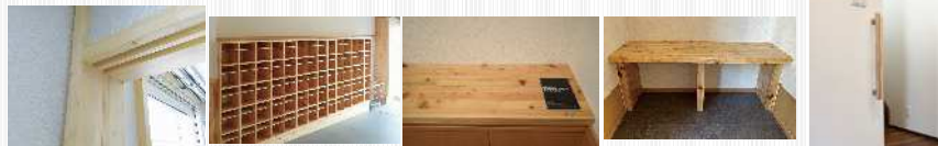
造作材 家具 カウンター ベンチ 手すり

このマークは、協議会ガイドラインに基づき、①抗菌、抗ウイルスについて国際規格の試験法により性能が確認され、②SIAAの安全性基準に適合し、③情報が適切に表示されていることを示すもので、その使用はSIAA会員に限定されています。