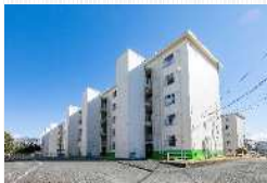
階段室にエレベータを設置