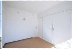
和室から洋室への間取り変更