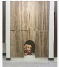
扉を閉じると お部屋はすっきり

● 商品紹介動画をyoutube「パネ協チャンネル」に掲載しています。是非ご覧ください。