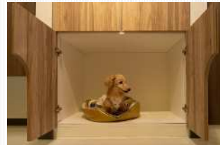
システム収納家具の扉を開くと その中にゆったりとしたペットスペース

扉はメラミン化粧貼りとなっているため、汚れや傷に強く、お掃除しやすく安心してご使用いただけます。