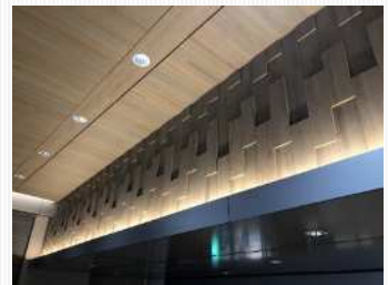
自由通路の下がり壁