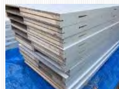
水廻りパネルユニット部材