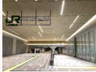
JR新小岩駅自由通路

内装の木質化により空間に温かみをもたせ、二酸化炭素固定化による環境負荷軽減にも貢献することができました。