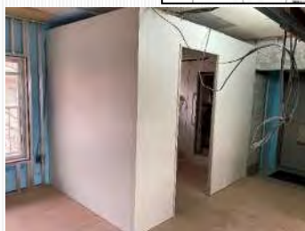
水廻りパネルユニットの試験的設置