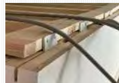
アタッチメントによる天井パネルと壁パネルの接続