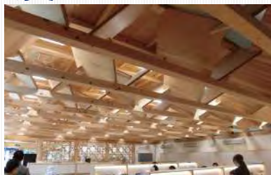
飯能商工会議所の平行弦トラス