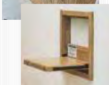
アシストチェアー